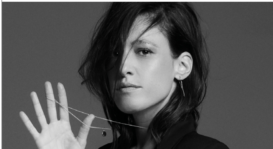
Figura de proa do fado e uma das principais artistas portuguesas dos últimos tempos. Um novo álbum aguardado para o início de 2023 naquele que será o 5º trabalho de inéditos de Carminho e que pretende colocar definitivamente um marco profundo como criadora, compositora, autora, intérprete, agregadora cultural e inspiração máxima de um Portugal contemporâneo.